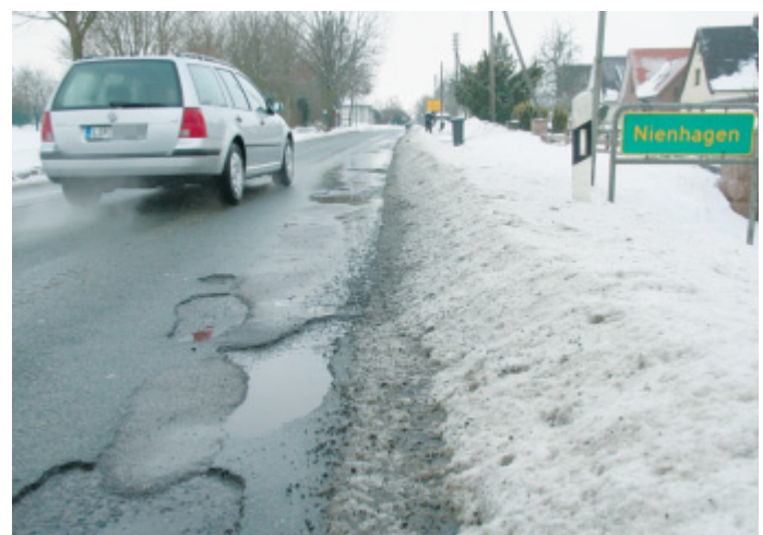
Unübersehbare Schäden: Der Kreis hat zugesagt, dass die Herforder Straße (K5) in diesem Jahr auf jeden Fall saniert wird.

„Die Herforder Straße wird in 2011 saniert“, versichert Rainer Huneke im Gespräch mit dieser Zeitung. Er ist Teamleiter Planung und Bauen beim Kreis und zuständig für den Straßenerhaltungsvertrag Lippe. 60 Maßnahmen stehen für dieses Jahr im Programm. „Um den Gegebenheiten Rechnung zu tragen“, müsse es nach dem Winter allerdings noch einmal aktualisiert werden. Nach einer Bestandsaufnahme erfolge eine Schadenserhebung für sämtliche Kreisstraßen, so Huneke. Danach werde festgelegt, in welcher Reihenfolge die Sanierungen abgearbeitet werden.